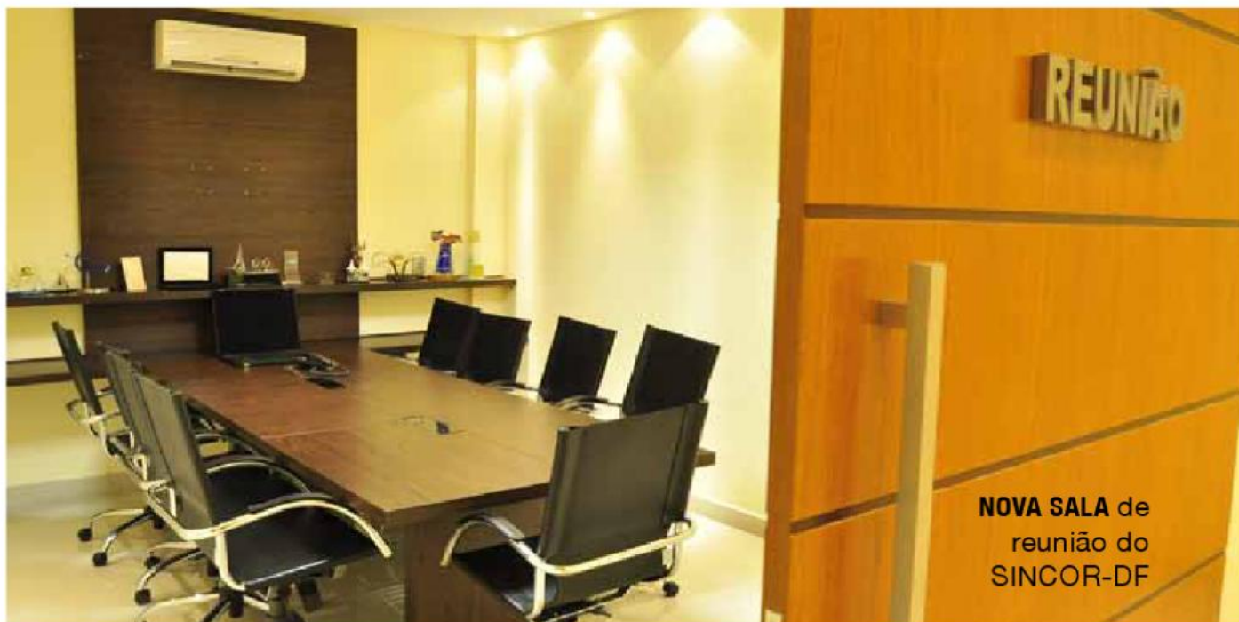
NOVA SALA de reunião do SINCOR-DF

diálogo com o governo, com o Congresso. Essa é a casa do corretor de seguros, mais do que isso, essa é a casa do mercado de seguros”.