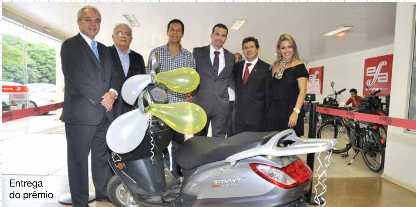
Entrega do prêmio