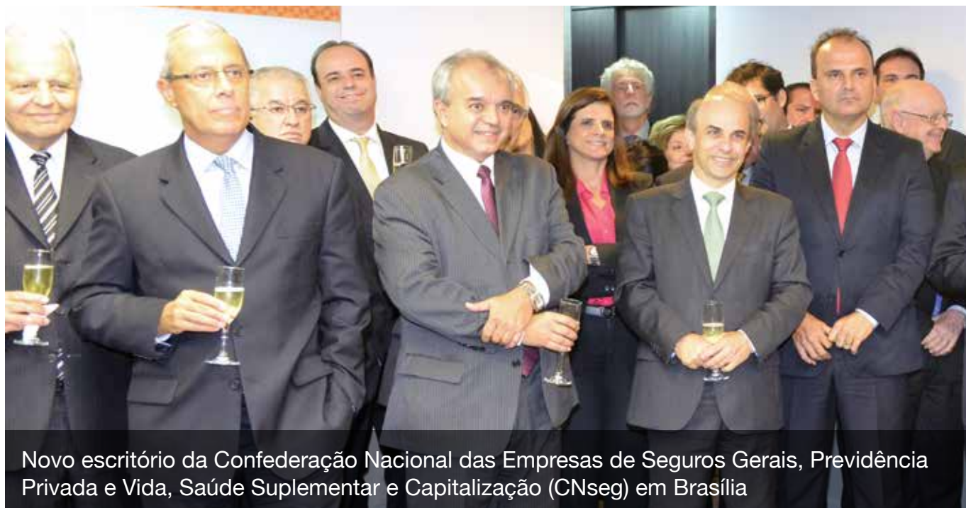
Novo escritório da Confederação Nacional das Empresas de Seguros Gerais, Previdência Privada e Vida, Saúde Suplementar e Capitalização (CNseg) em Brasília

A eleição da nova Diretoria da Confederação Nacional das Empresas de Seguros Gerais, Previdência Privada e Vida, Saúde Suplementar e Capitalização (CNseg) e uma reunião do atual Conselho marcaram a ampliação do escritório da entidade em Brasília, realizada em 19 de março.